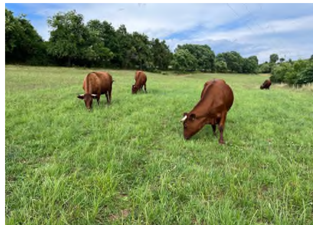
Sommer 2024