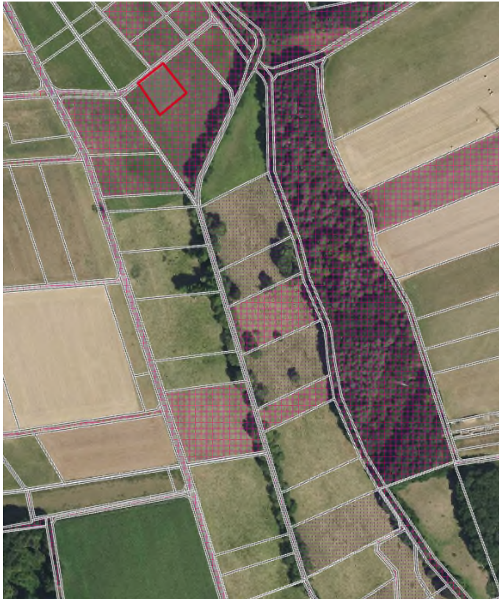
Abb. 2 Lage der Gemeindeflächen im Projektgebiet (kariert, rot markiert = der 1. Änderung des BBPl Auf dem Kautz zugeordnete Kompensationsfläche; natureg-viewer, Abruf Mai 2026, HLNUG)

Die Gemeinde verfügt im Projektgebiet über die Flurstücke 3, 4, 12, 72/2, Flur 22. Die Flurstücke 14 und 21, Flur 22 sind vom Privateigentümer gepachtet. Etwa 4.460 m 2 des Flurstücks 72/2 sind bereits Eingriffen als Kompensationsfläche zugeordnet.