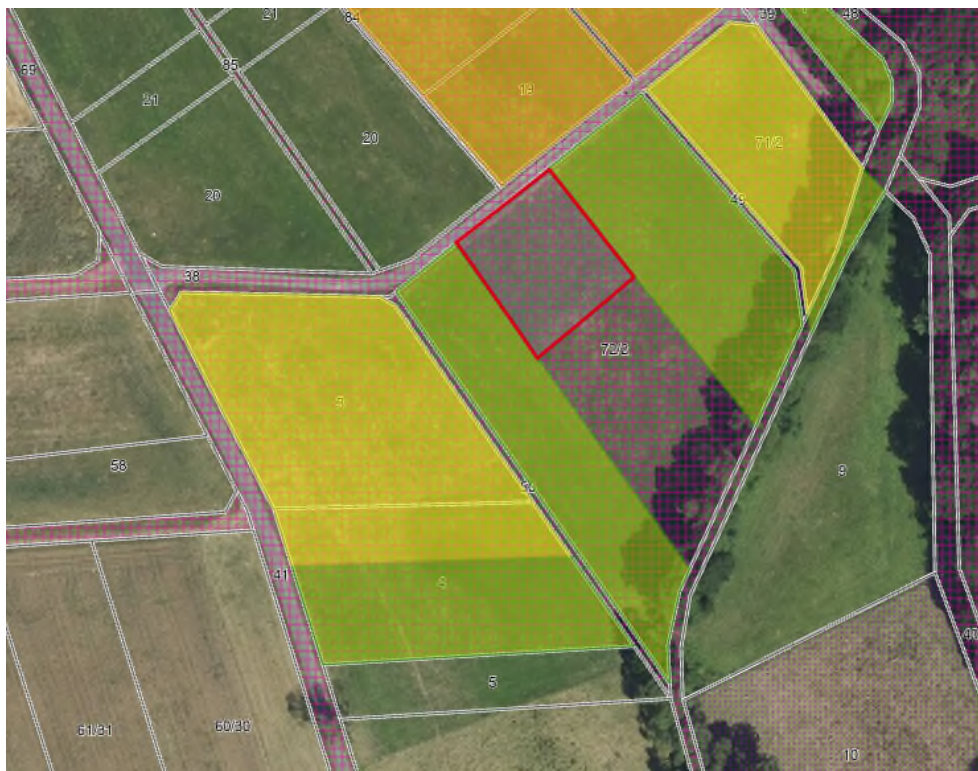
Abb. 5 Zuordnung Kompensationsfläche (rot, Flur 22, Flurstück 72/2) 1. Änderung des BBPl Auf dem Kautz (Kartengrundlage natureg-viewer, mit Darstellung von bestehenden Kompensationsflächen (grün, gelb) sowie der gemeindeeigenen Flächen (kariert) und Zuordnung einer Fläche zum geplanten Eingriff durch den BBPl; Abruf Mai 2026)

Die Fläche ist geeignet den Eingriff in den Naturhaushalt (Hecken/Gebüsch, Straßenränder, nicht begrünte Dachflächen und Gärten in Ortsrandlage) zu kompensieren. Da das Projekt bereits umgesetzt wurde, ist auch kein Time Lag bis zum Wirksamwerden der Kompensationsmaßnahme zu berücksichtigen.