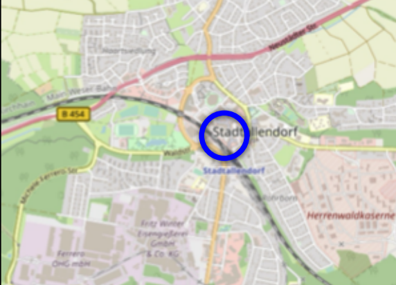
Räumliche Lage (OpenStreetMap - unmaßstäblich)