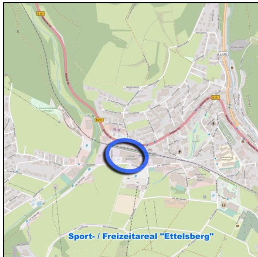
Abbildung 1: Räumliche Lage – OpenStreetMap

Der Bebauungsplan Nr. 27 „Am Ettelsberg“ (rechtskräftig seit 02.07.2021) wurde aufgestellt, um die Rahmenbedingungen für die Entwicklung eines urbanen Quartiers in der Schnittstelle zwischen dem Sport- und Freizeitareal „Ettelsberg“ im Süden und der westlichen Siedlungslage von Willingen mit Bahnhof und Nahversorgungszentrum im Norden zu schaffen. Funktionaler Bestandteil dieser Verbindungsachse ist eine geplante Fußgängerbrücke über die nördlich das Plangebiet tangierende Bahnstrecke, welche die genannten Bereiche fußläufig verbinden soll.