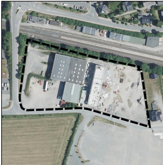
Abbildung 2: Plangebiet auf Luftbildbasis